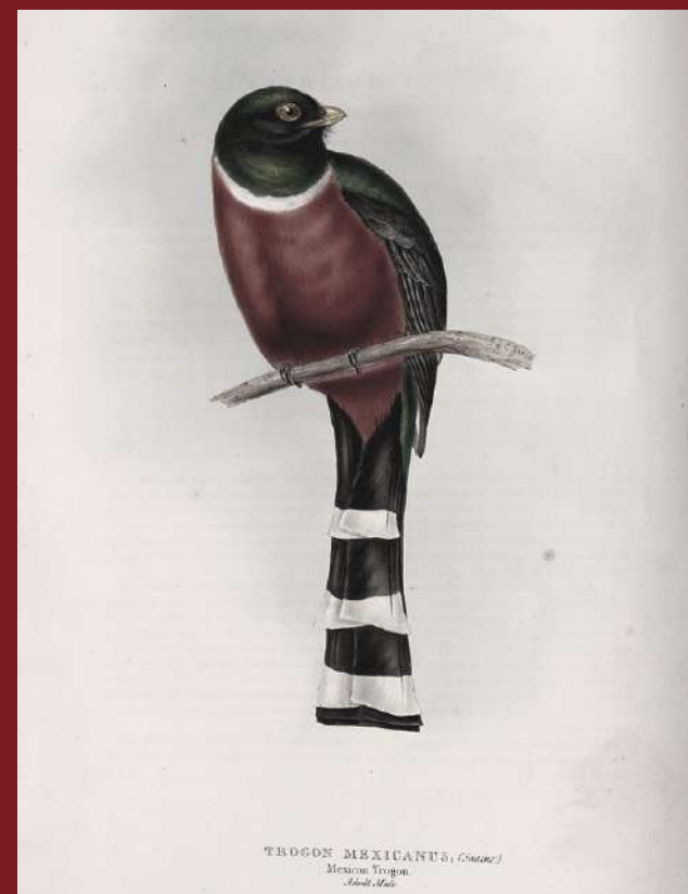
GOULD (1839). A monograph of the Trogonidae, or Family of Trogons.

Biblioteca digital de obras raras Catálogo online do acervo Comutação bibliográfica Consulta à coleção de obras raras e in-fólios Empréstimo domiciliar Empréstimo entre bibliotecas Ficha catalográfica Nada consta Normalização de documentos Pesquisa bibliográfica Portal de periódicos da Capes Renovação online Treinamento de usuários Visita guiada